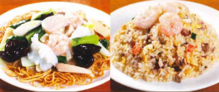
五目入りチャーハン